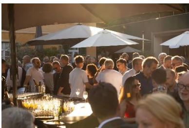
The Schubidu Quartet