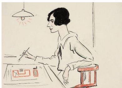
Foto: Architektin Margarete Schütte-Lihotzky, gezeichnet von Lino Salini, © Historisches Museum Frankfurt (C29894)

Eine gesonderte Aussendung mit weiteren Details zur Veranstaltung folgt in Kürze. Krankheitsbedingt konnten nicht alle Programmpunkte final bestätigt werden. Das bisherige Programm finden Sie hier .